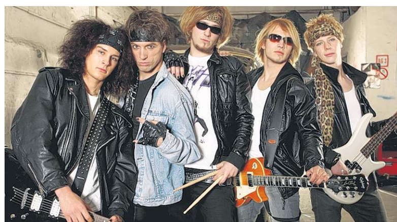
Rocken die Bühne auf dem Hochschultag in Neubrandenburg: die fünf Jungs von „Looks that kill“ aus Greifswald.